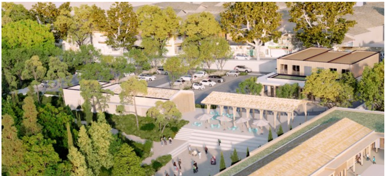
Vue des halles (projet)