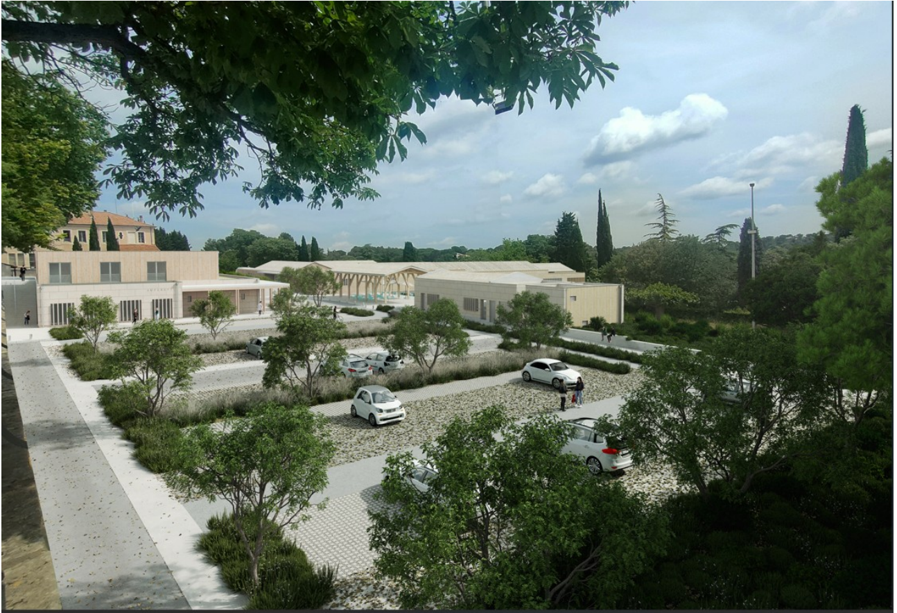
Vue depuis la Promenade (projet)