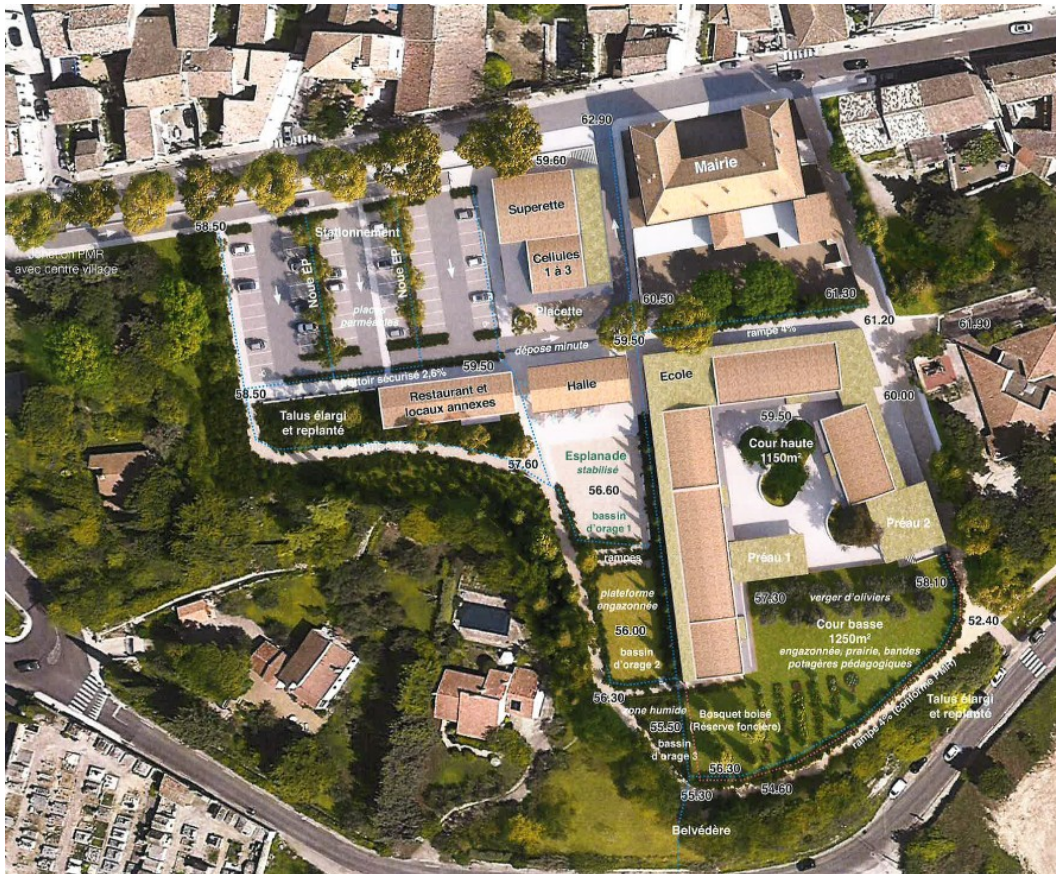
Plan de situation (projet)