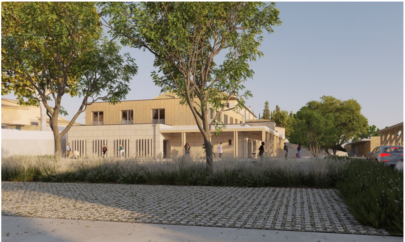
Vue des commerces (projet)