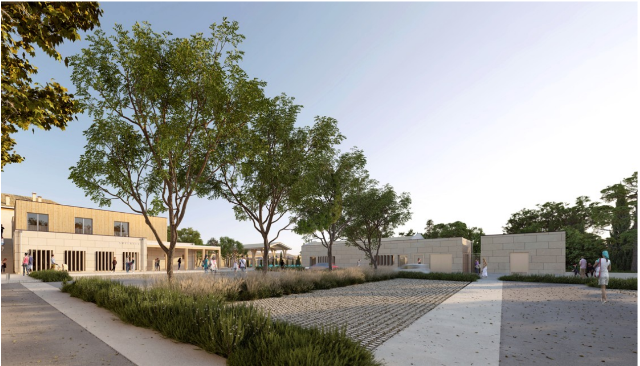
Vue du parking (projet)