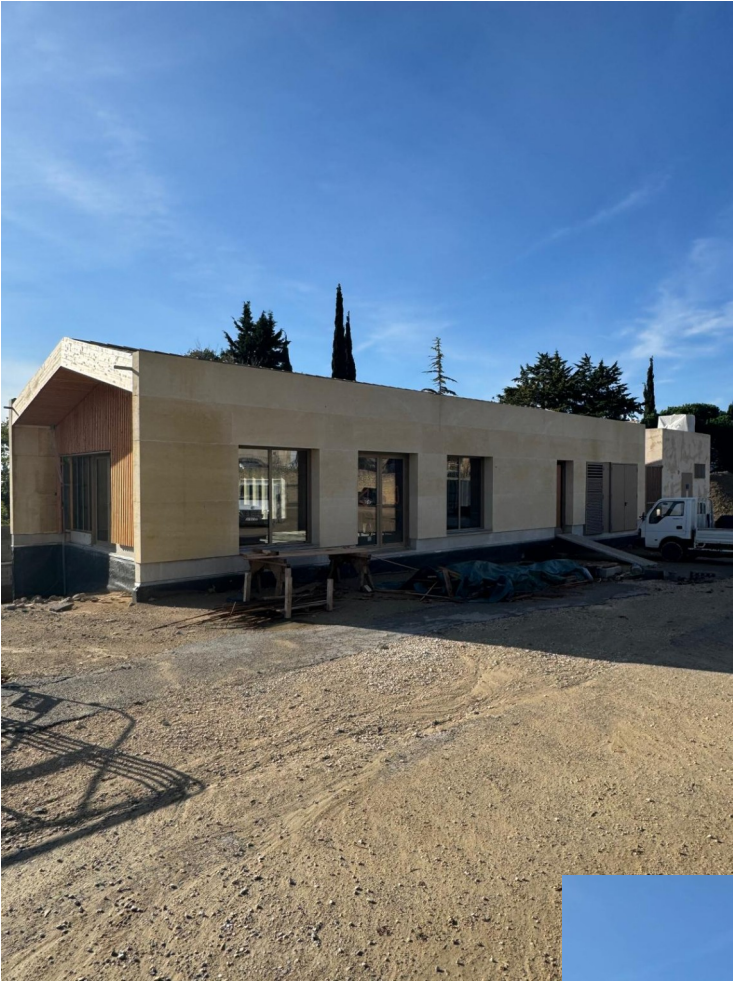
Façade côté parking