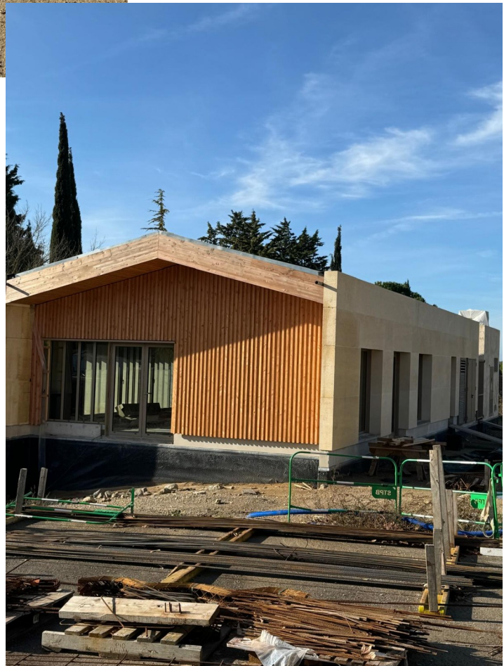
Façade côté terrasse